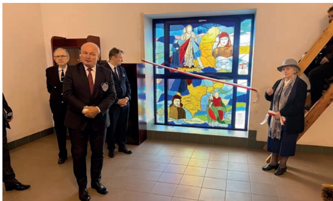
Uroczystość odsłonięcia witraża „Kresy Rzeczypospolitej”

Podczas uroczystości w Nekropolii Sanktuarium MBNP w Osiedlu Stałym umieszczono urnę z ziemią z miejsca katastrofy lotniczej Franciszka Żwirki i Stanisława Wigury w Cierlicku. Odślonięto również tablicę pamiątkową „Pamięć Bohaterom Przystworzy”. Ponadto w Muzeum Skarbiec odsłonięto witraż „Kresy Rzeczypospolitej” upamiętniający 90. rocznicę zwycięskiego Challenge Żwirki i Wigury oraz ich katastrofy w samolocie RWD-6.