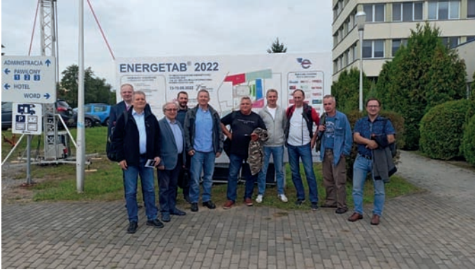
Uczestnicy Targów z Koła SEP nr 38