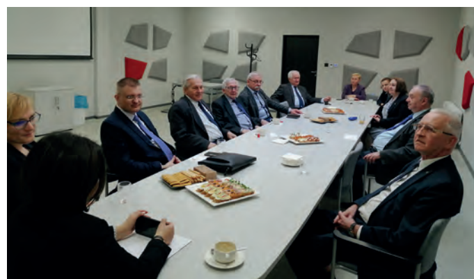
Spotkanie z Zarządkiem Oddziału Łódzkiego SEP