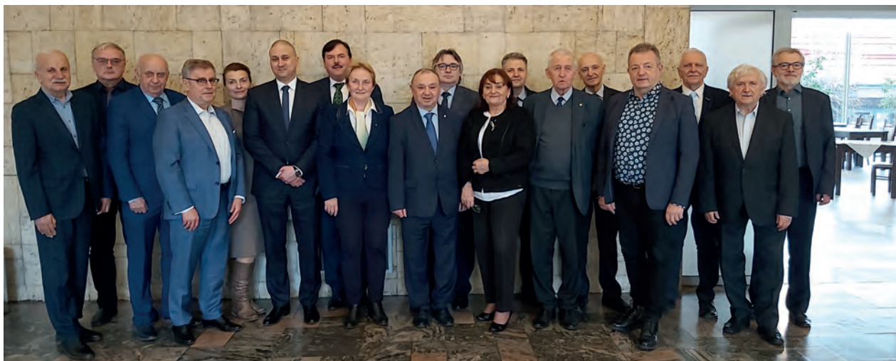
Zarząd Oddziału Zagłębia Węglowego SEP w kadencji 2018-2022