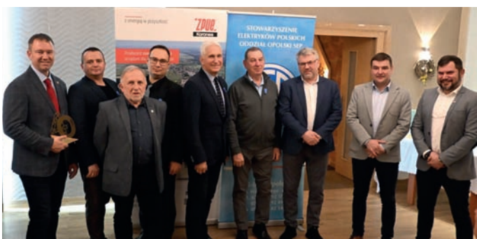
Wyróżnieni członkowie Koła SEP nr 24