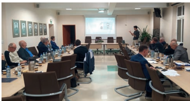
Sala Politechniki Opolskiej podczas prezentacji uczestników konkursu